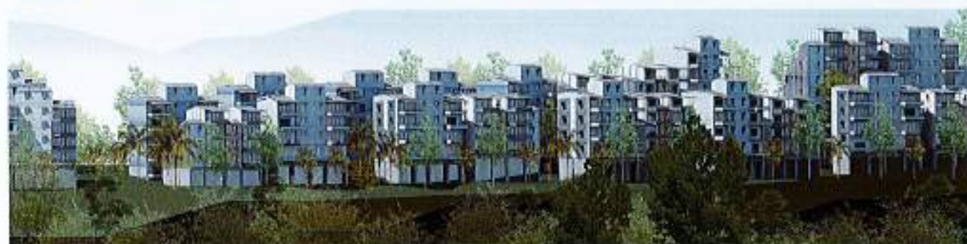
Figure 1 : Perspectives Doujani demain.